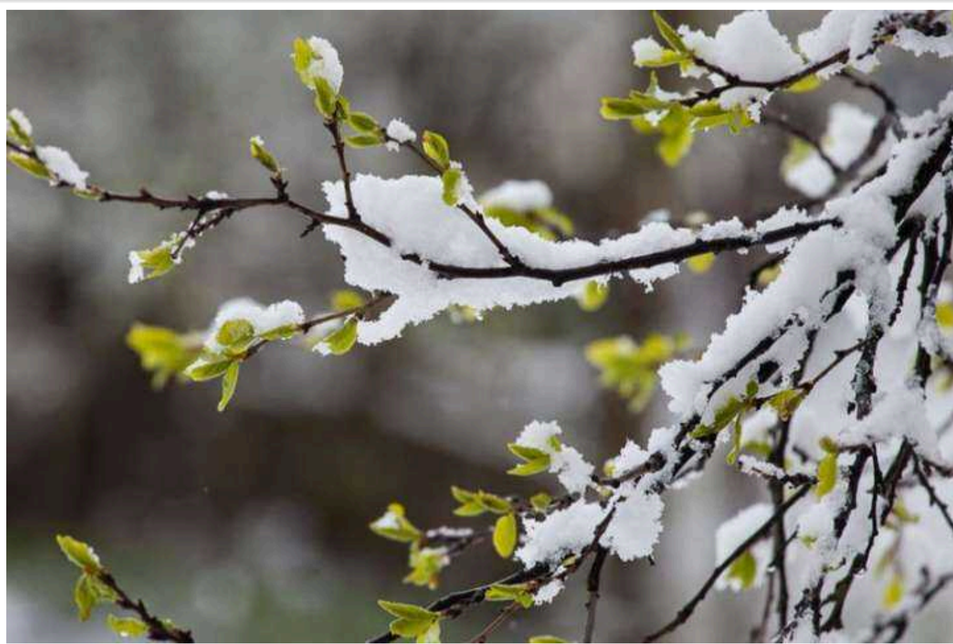
В Україну йде тепло до +17 градусів, – синоптик

За її словами, весна вже стукає українцям у двері.