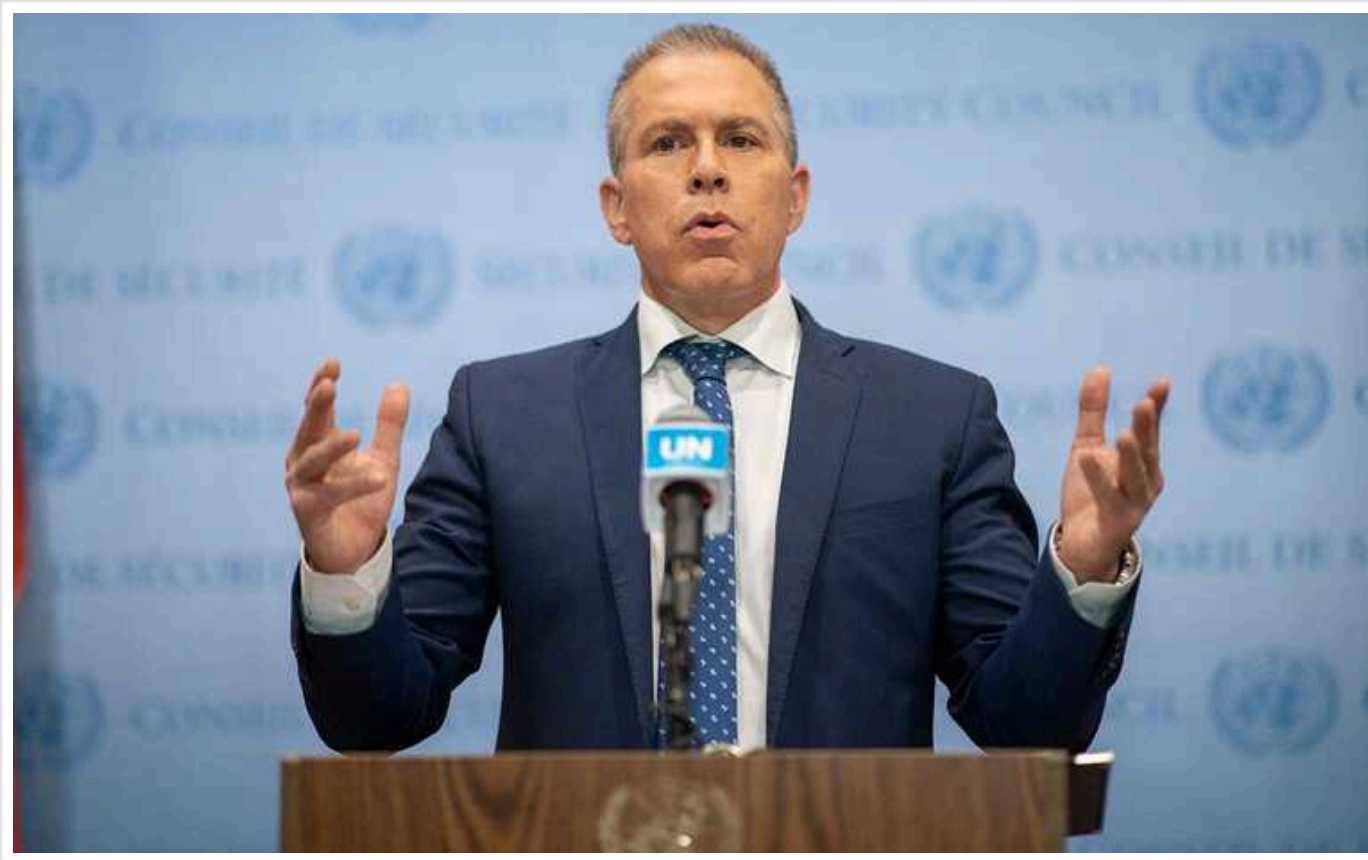
Ізраїль надасть Україні систему раннього попередження про ракетний удар

Про це повідомив постійний представник Ізраїлю в ООН Гілад Ердан.