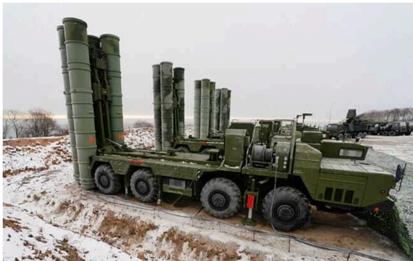
Окупанти протестували комплекс С-500, який нібито може збивати гіперзвукові цілі, – Defense Express

Російські військові провели випробування ЗРК С-500 "Прометей", який за їхніми словами нібито може збивати гіперзвукові цілі.