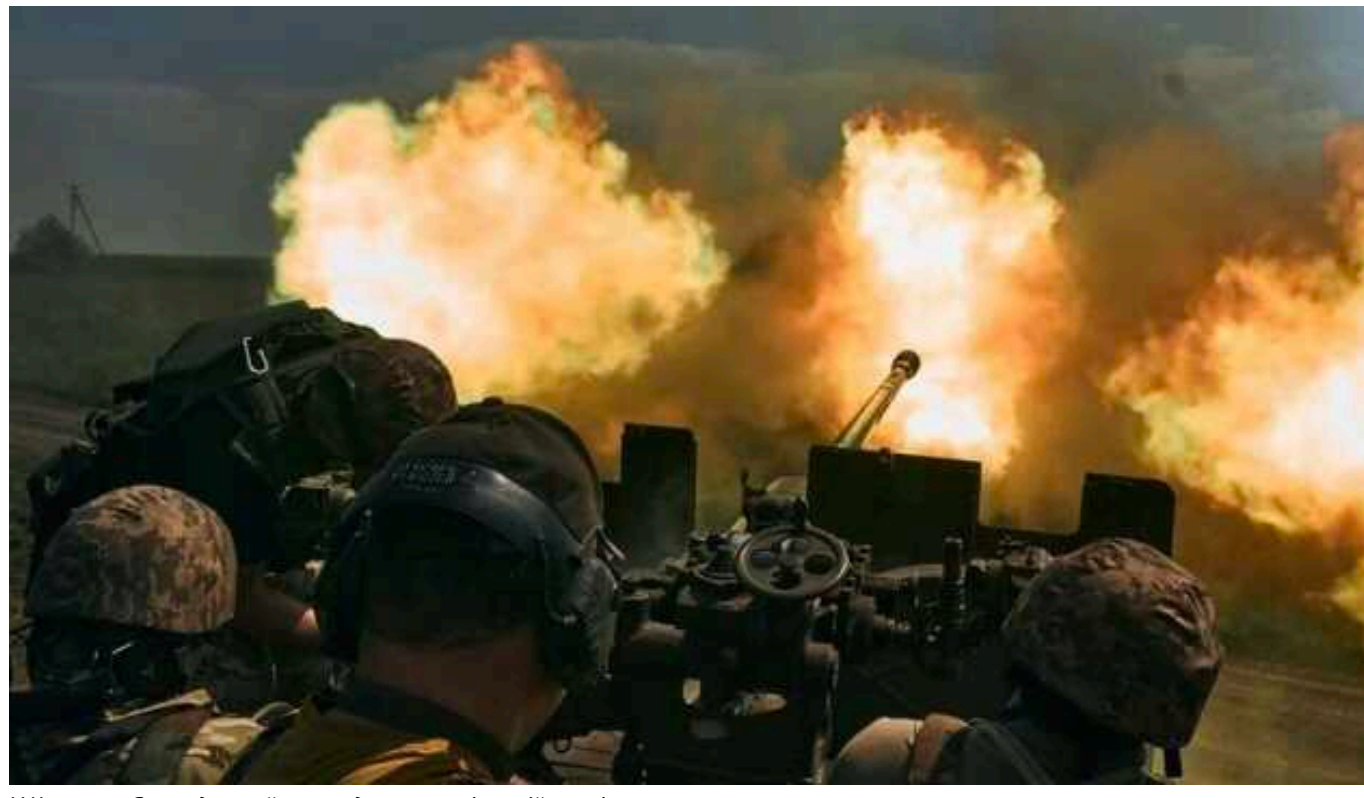
У Часовому Яру надзвичайно складна ситуація, – військові

ТГ-канали українських військовослужбовців підтверджують інформацію про надзвичайно складну ситуацію поблизу Часового Яру.