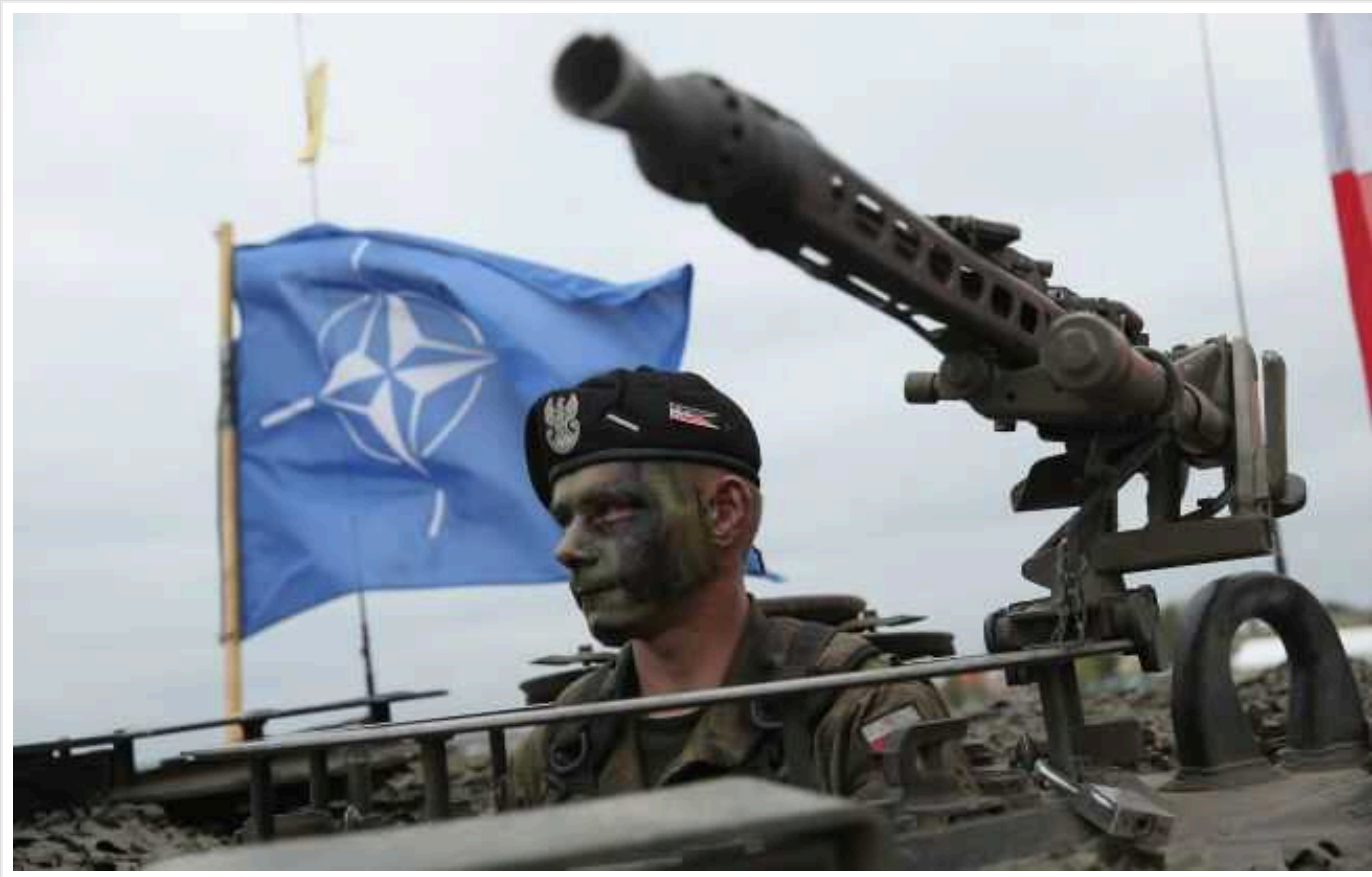
Альянс "нейтралізує" Калінінград першим, якщо РФ кине виклик НАТО, - посол Литви

Країни Північноатлантичного альянсу відразу "нейтралізують" Калінінград, якщо росіяни кинуть виклик НАТО.