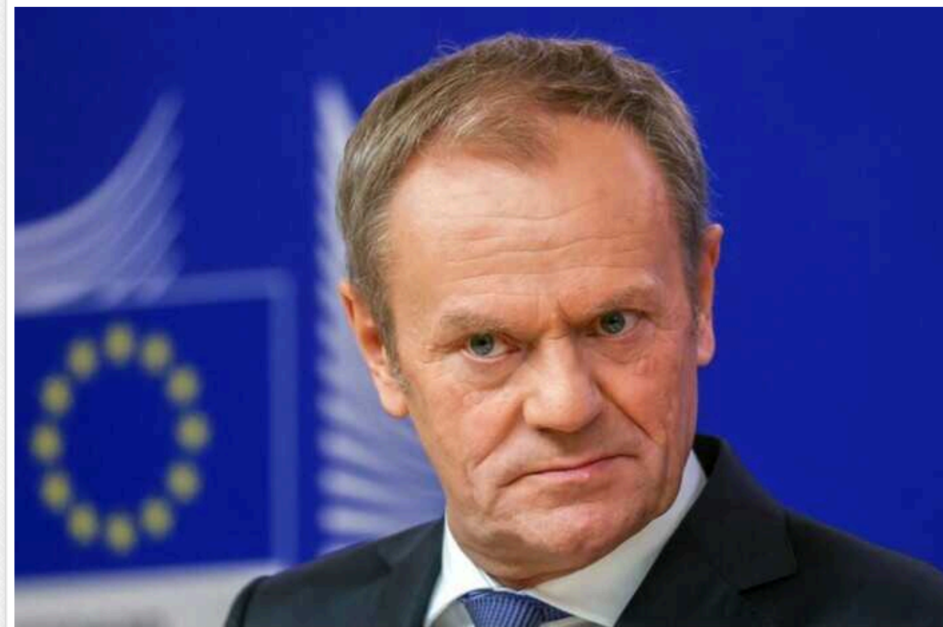
Польща розширить заборону на імпорт українських товарів, якщо Євросоюз не запропонує вирішення проблеми із польськими фермерами

Про це заявив у Празі прем'єр-міністр Дональд Туск.