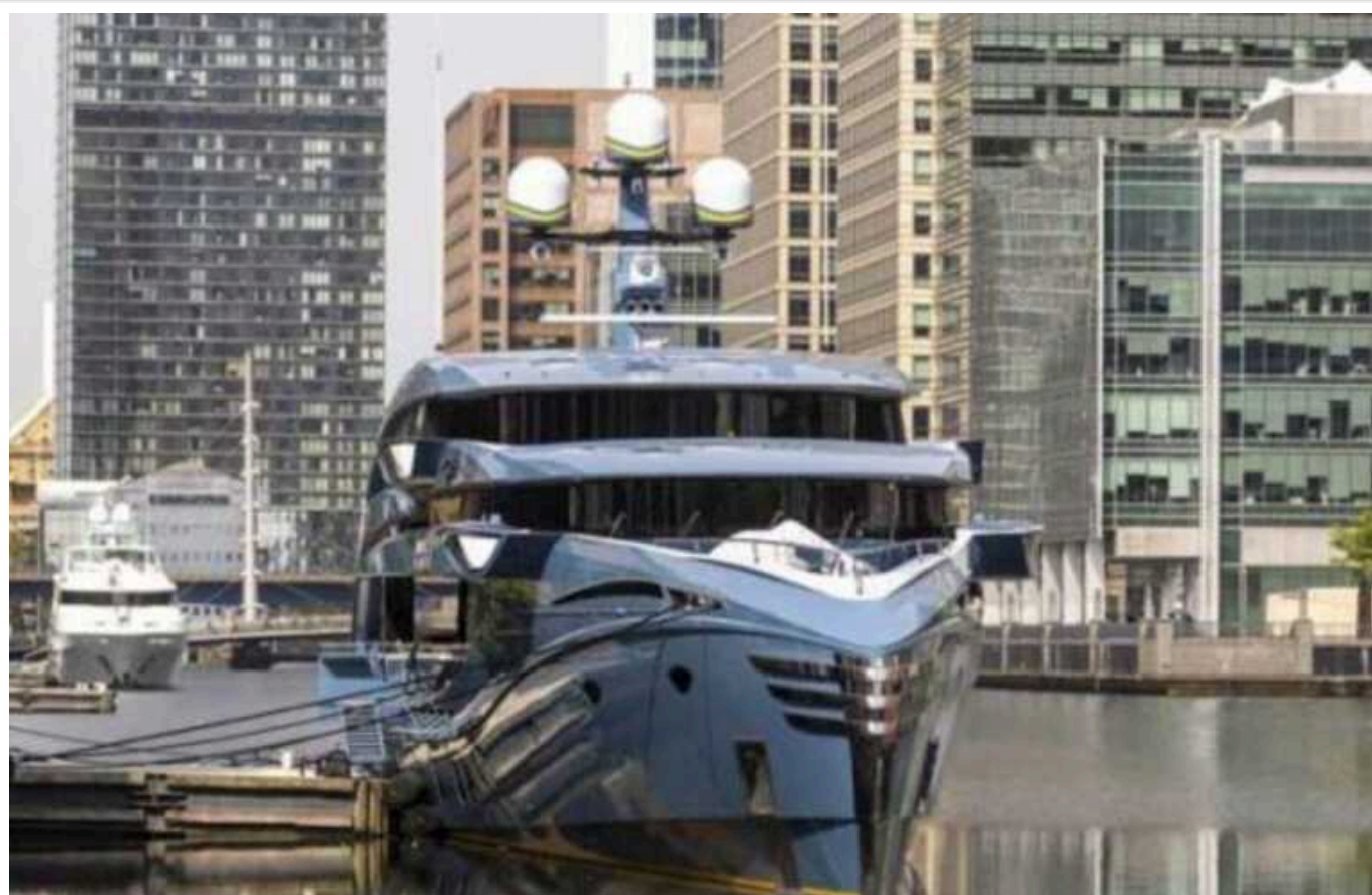
Російські олігархи програли апеляцію щодо арешту своїх літаків та яхт у Британії

Досі британський уряд не програв жодного судового процесу щодо антиросійських санкцій.