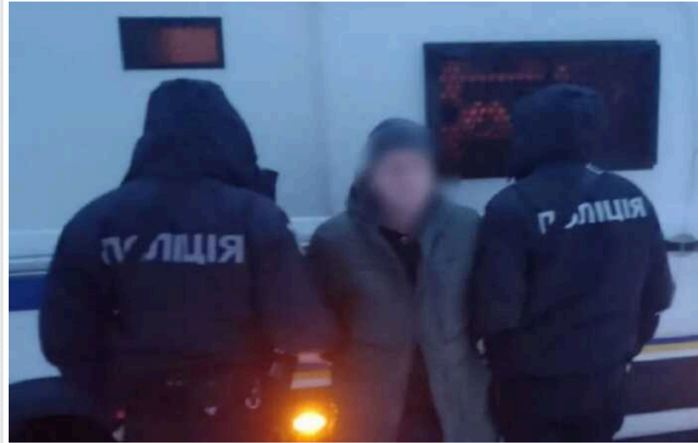
На Київщині судитимуть чоловіка, який зґвалтував 9-річну доньку

На Київщині за зґвалтування 9-річної доньки судитимуть мешканця Броварського району. Крім того, він вчинив насильницькі дії сексуального характеру щодо дитини.