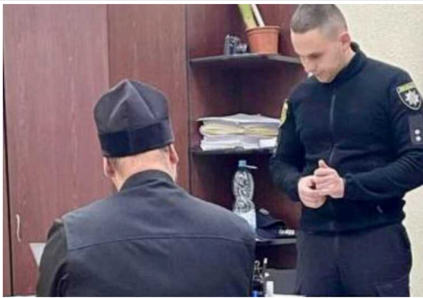
На Закарпатті викрили московських попів у пропаганді тоталітарного режиму

Настоятелю храму та священнику чоловічого монастиря Хустської єпархії УПЦ МП загрожує до п'яти років ув'язнення.