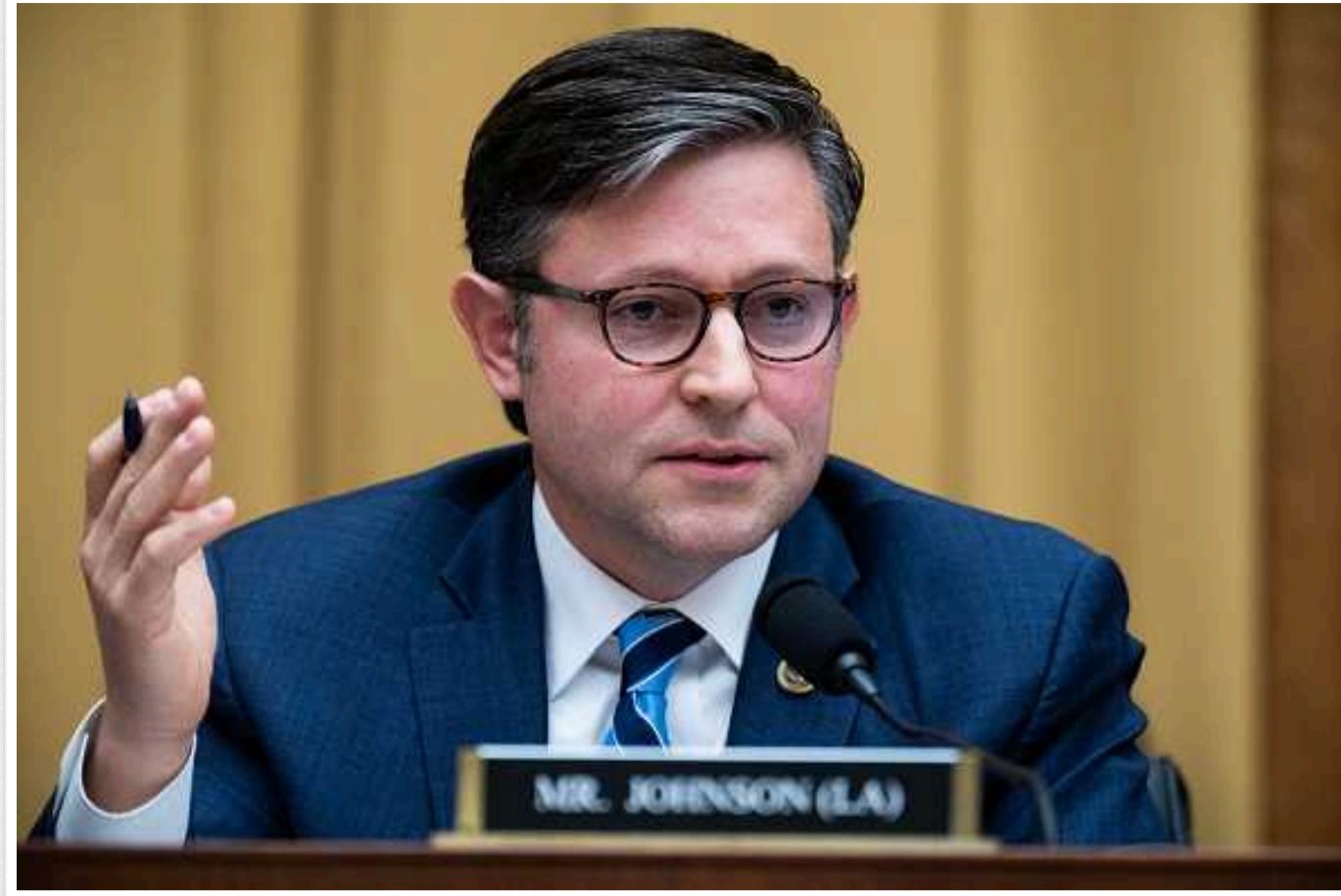
Майк Джонсон після зустрічі з президентом Байденом заявив, що «тиснув на Байдена щодо необхідності плану кордону»

Про це повідомляє журналіст CNN Ману Раджу у X.