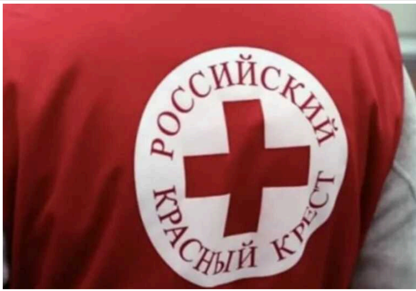
Представники російського "Червоного Хреста" могли знущатися з українських полонених у колонії – ЗМІ

Країна-агресорка РФ фінансує російське відділення "Червоного хреста" окремо з федерального бюджету. А співробітники цієї "гуманітарної" організації могли знущатися з українських військовополонених у російських колоніях, зокрема й у розміщених на тимчасово окупованих територіях України.