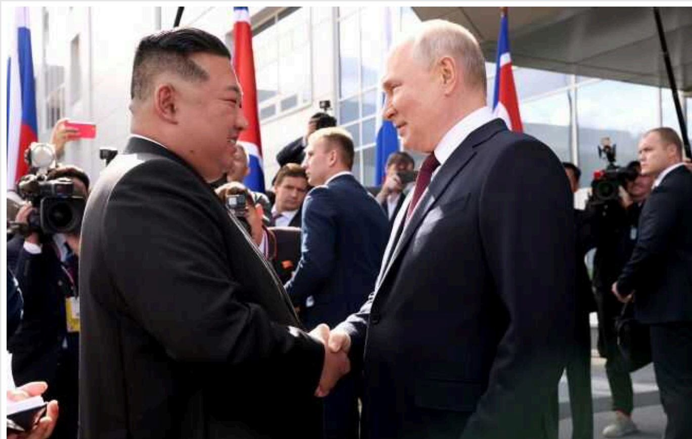
Північна Корея відправила РФ не менше кількох мільйонів боєприпасів, – Південна Корея

Північна Корея передала Росії кілька мільйонів боєприпасів для артилерії. Загалом до РФ відправили понад шість тисяч контейнерів зі снарядами.