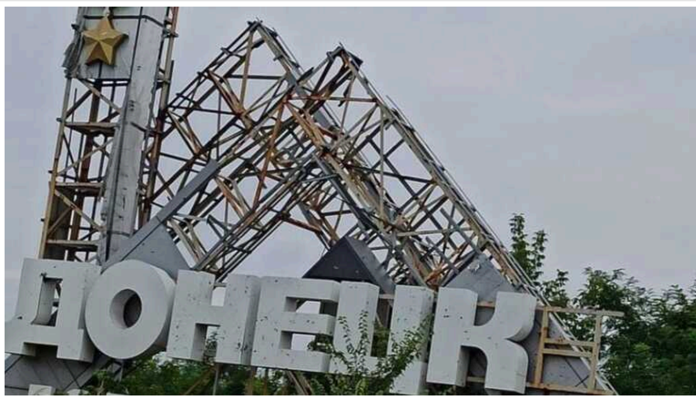
У деяких районах окупованого Донецька почалися проблеми з продажем нерухомості

У прифронтових районах окупованого Донецька перестали продавати та купувати нерухомість.