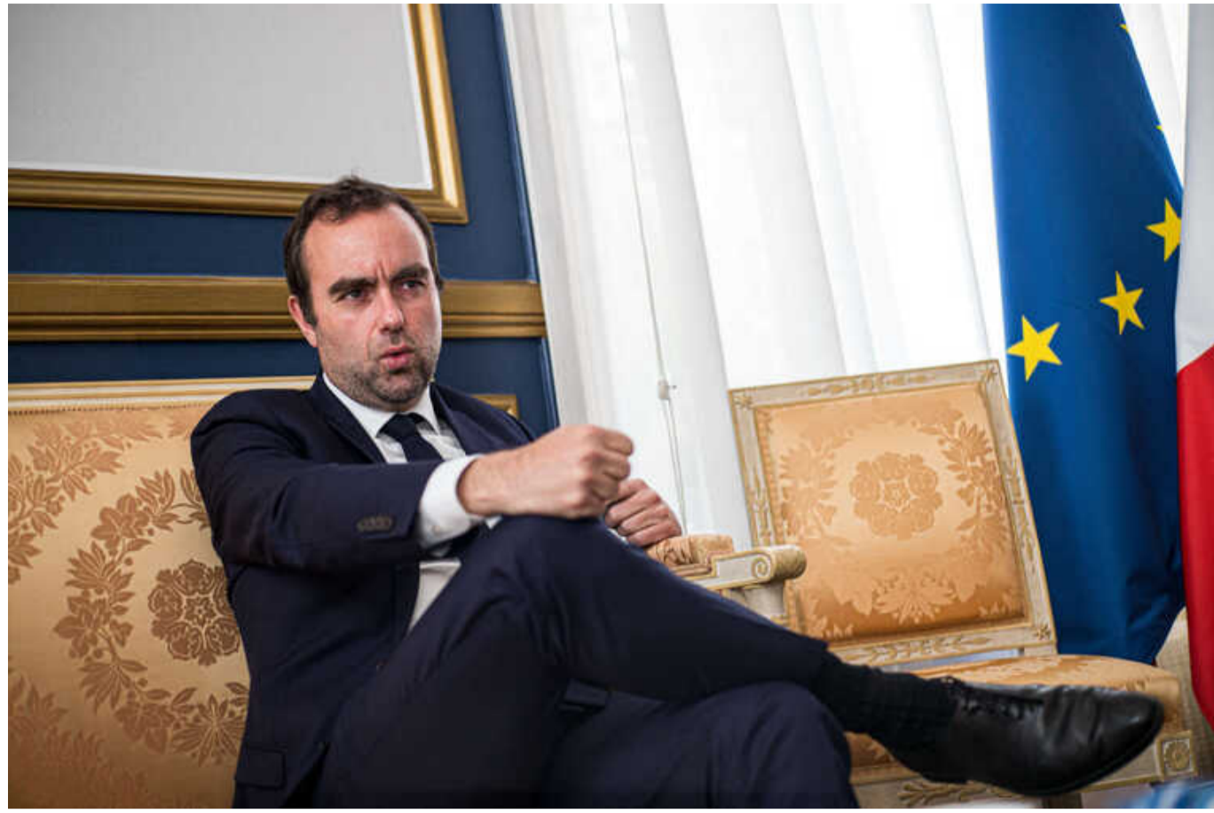
Франція планує збільшити виробництво артилерійських снарядів до 5 тисяч на місяць

Франція має збільшити виробництво артилерійських боєприпасів і вийти на показники в 4-5 тисяч штук на місяць.