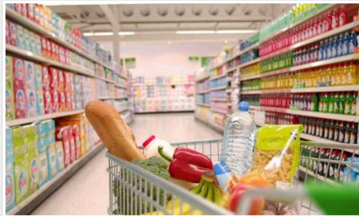
В Україні за два роки війни ціни на базові продукти зросли на 30-50%

За два роки від початку повномасштабного вторгнення Росії в Україну суттєво зросли ціни на базові продукти. Підвищення зарплат і пенсій теж було, але воно не встигало за зростанням цін.