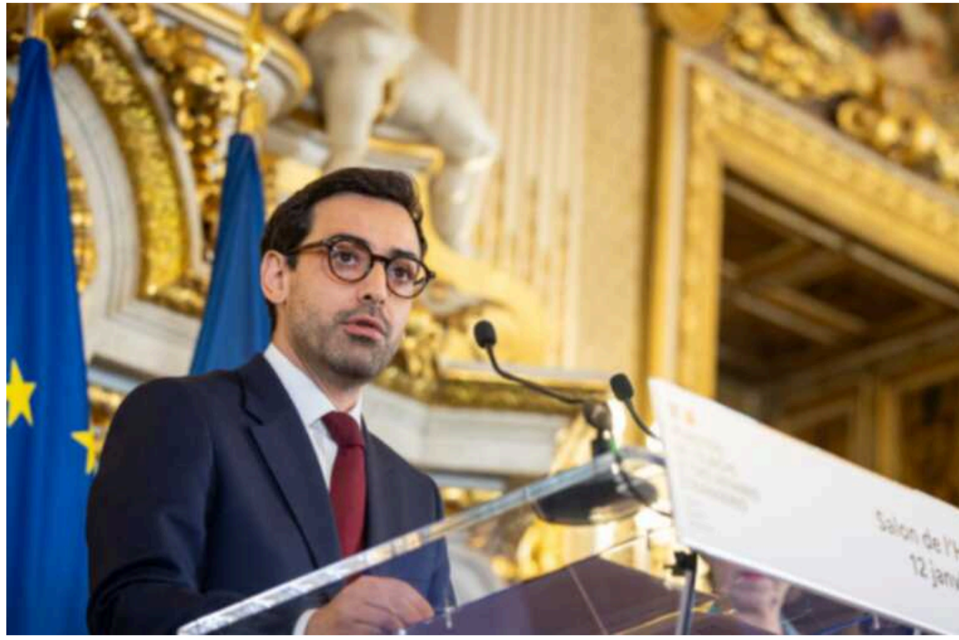
Розміщення західних військ в Україні не означає їхню участь у воєнних діях, – МЗС Франції

Глава Міністерства закордонних справ Франції Стефан Сежурне прокоментував заяви президента Емманюеля Макрона про можливість відправлення військ в Україну.