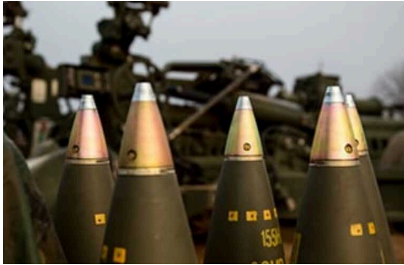
15 країн Євросоюзу домовилися закупити для України снарядів на 1,5 мільярда доларів

ЄС не може швидко надати Україні потрібну кількість боеприпасів, тож на зустрічі у Парижі вирішили закуповувати в інших виробників.