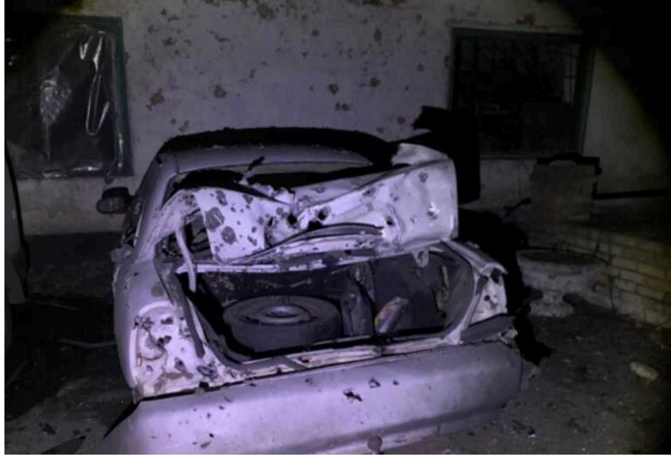
Окупанти вдарили по підприємству в Курахівській громаді: є загиблий і багато поранених

Російські війська сьогодні, 27 лютого, вдарили по Курахівській громаді в Донецькій області. Унаслідок цього загинула людина, ще п'ятеро дістали поранення.