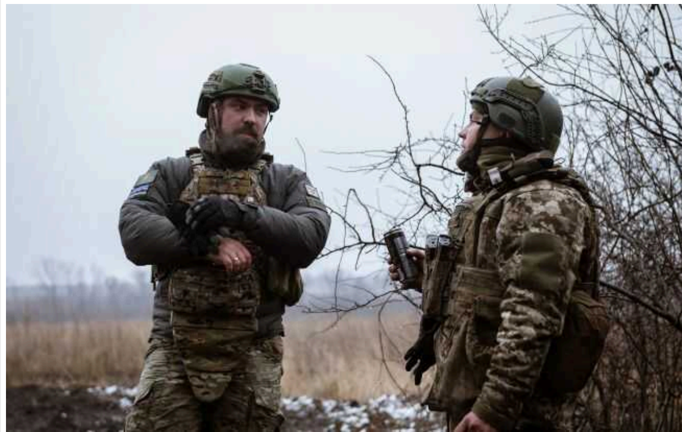
Ситуація на фронті: ворог завдав 4 ракетні та 52 авіаційні удари

Українські воїни утримують позиції на лівобережжі Дніпра, відбили атаки росіян біля Кліщіївки (Донецька область) і уразили радіолокаційну станцію противника.