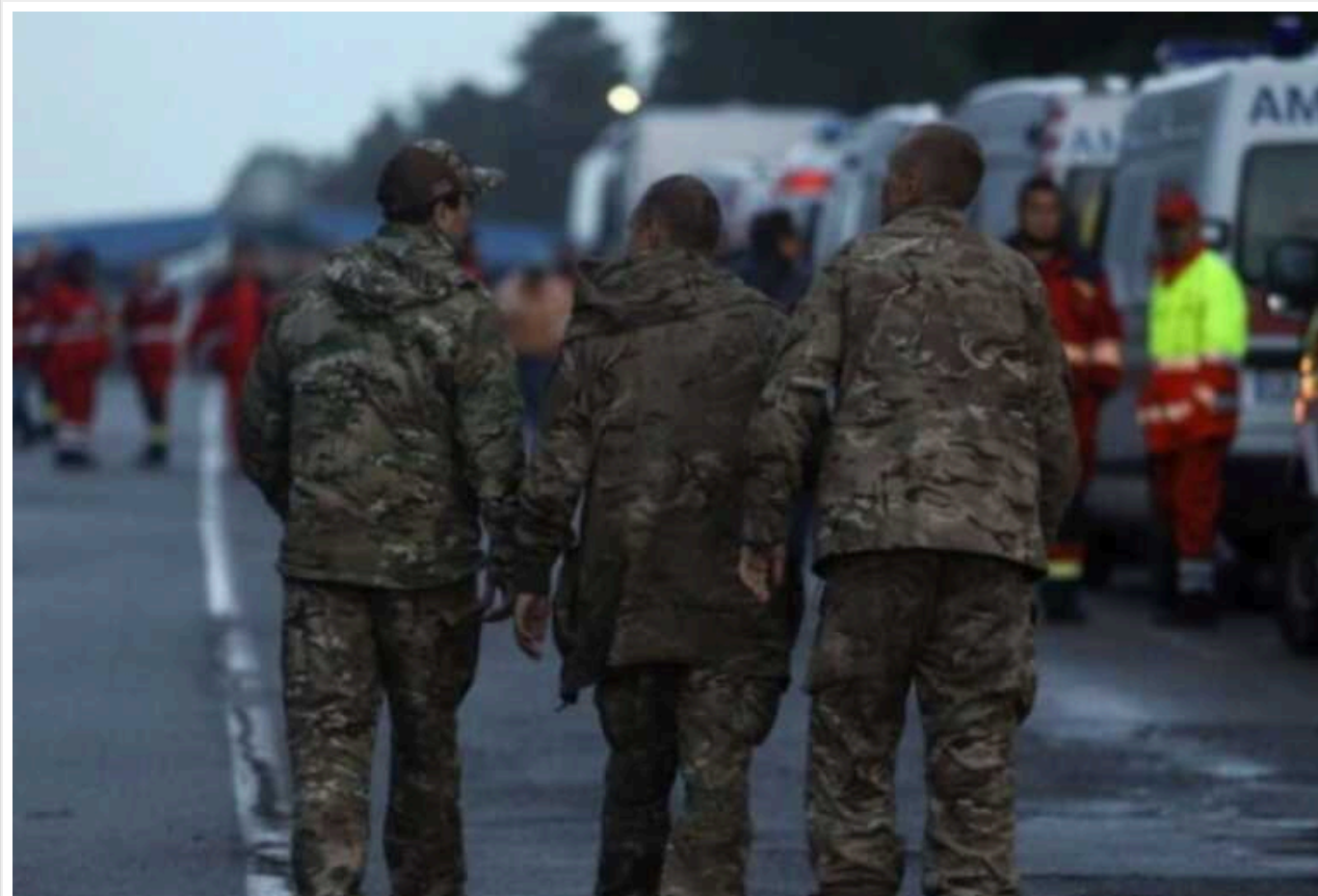
В Україні створюють інформаційну систему щодо військовополонених

Кабінет міністрів ухвалив постанову, яка затверджує Положення про інформаційну систему з питань поводження з полоненими.