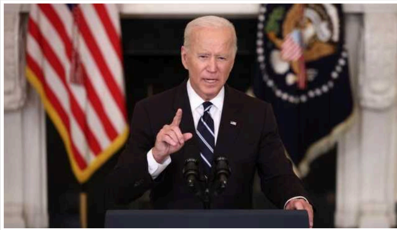
Президент США скликає лідерів Конгресу для обговорення допомоги Україні

Президент США Джо Байден зустрінеться з лідерами Конгресу у вівторок, 27 лютого. Вони мають обговорити питання допомоги Україні та голосування щодо фінансування роботи американського уряду.