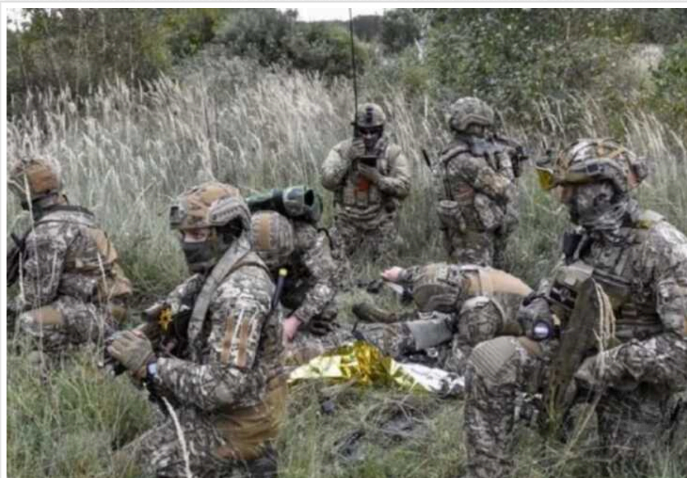
Кулеметник "Людоджер" розповів, як брали у полон російських окупантів

На війні є свої закони. І один з них чим - зухваліший маневр, тим менше ворог на нього чекає. Завдяки саме таким заходам українським військовим вдалось брати у полон окупантів без жодного пострілу.