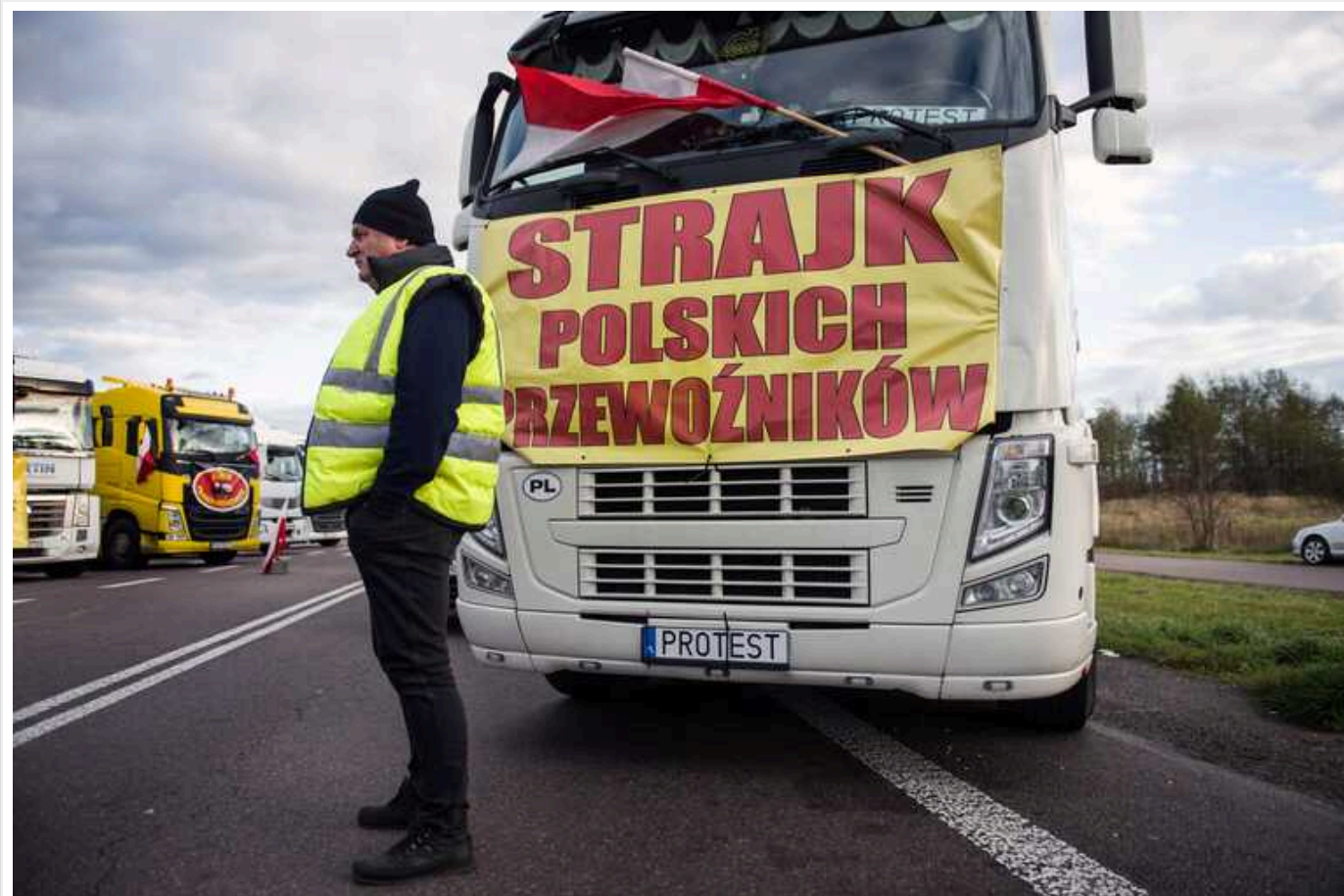
Польські фермери готують посилення блокади кордону – Мінінфраструктури

Мінінфраструктури України виконало всі домовленості щодо запобігання блокаді з боку польських перевізників. Втім, низка питань все ж залишається невирішеною. Проте за них, запевняється, відповідальна польська сторона.