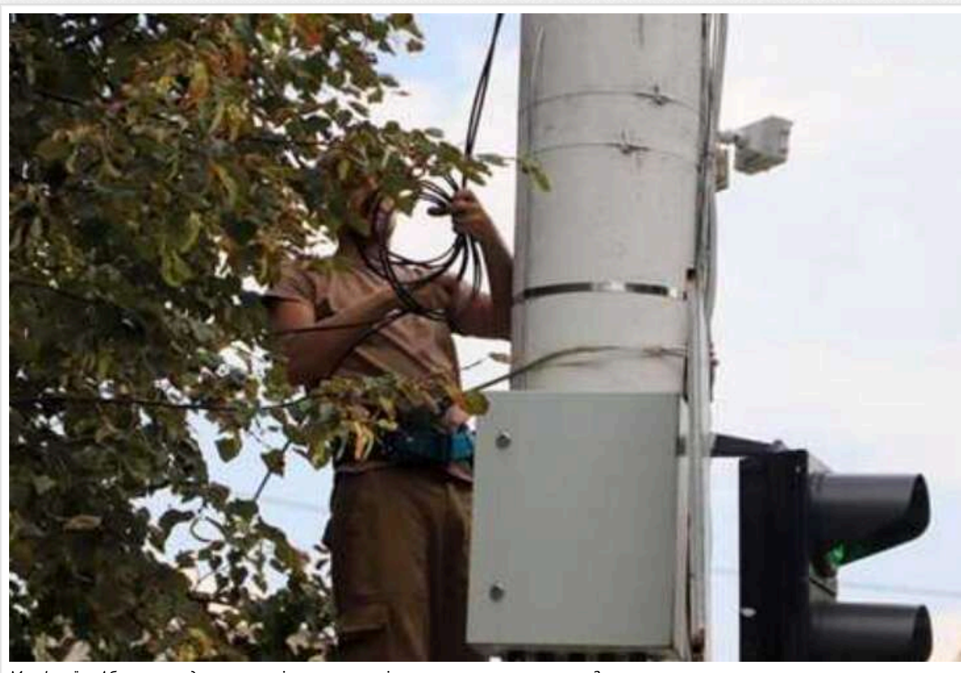
Мер Ізмаїла Абрамченко дозволив росіянам спостерігати за поставками в порт?

Система відеоспостереження, встановлена у місті Ізмаїл Одеської області, ґрунтується на софті, розробленому в Москві.