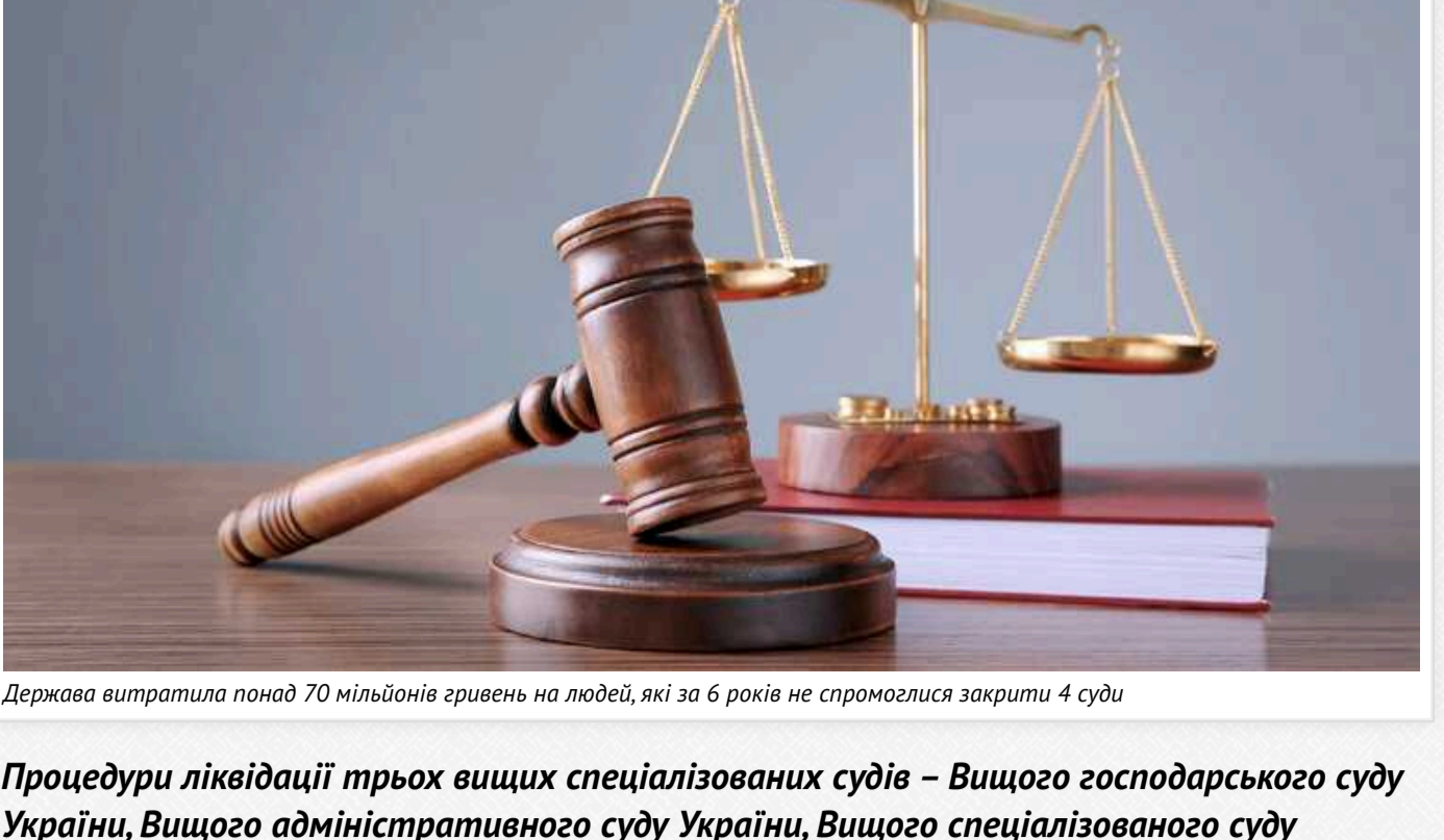
Держава витратила понад 70 мільйонів гривень на людей, які за 6 років не спромоглися закрити 4 суди

Процедури ліквідації трьох вищих спеціалізованих судів – Вищого господарського суду України, Вищого адміністративного суду України, Вищого спеціалізованого суду України з розгляду цивільних і кримінальних справ та Верховного Суду України – неабияк затягнулися