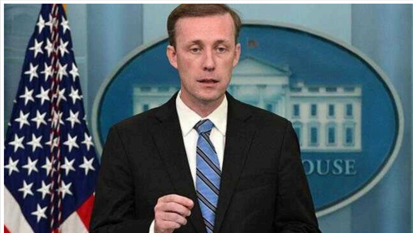
Салліван про блокування допомоги Україні: "Путін "виграє" щодня"

Радник президента США з національної безпеки Джейк Салліван заявив, що Володимир Путін "виграє щодня", оскільки Палата представників США відкладає ухвалення нового пакету допомоги для України.