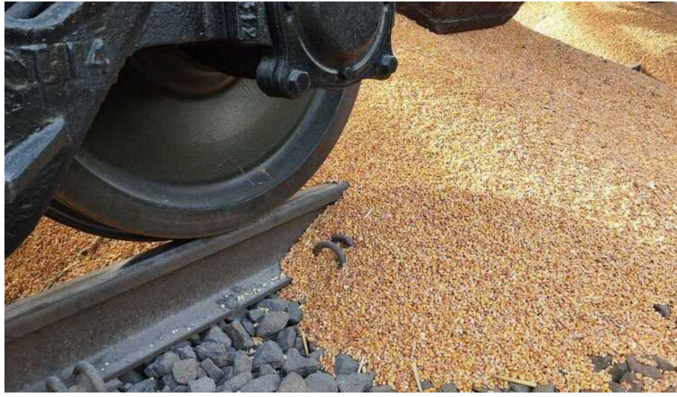
У Мінінфраструктури показали, як опломбовують усі українські вагони: зерно не могло потрапити на ринок Польщі

Усі вагони з українським зерном проходять процедуру опломбування на кордоні з Польщею. Так, заборонені поляками продукти не можуть потрапити на ринок цієї країни, вони прямують її територією лише транзитом. Йдеться про пшеницю, кукурудзу, рапс та соняшник – саме ці культури польські фермери-протестувальники безпідставно висипають на кордоні.