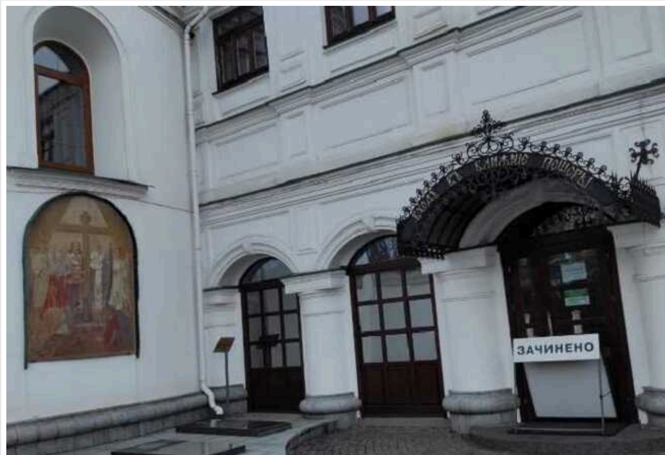
Московський патріархат відмовив військовим у молитві у печерах Києво-Печерської лаври

Про це повідомляє пресслужба Національного заповідника "Києво-Печерська лавра".