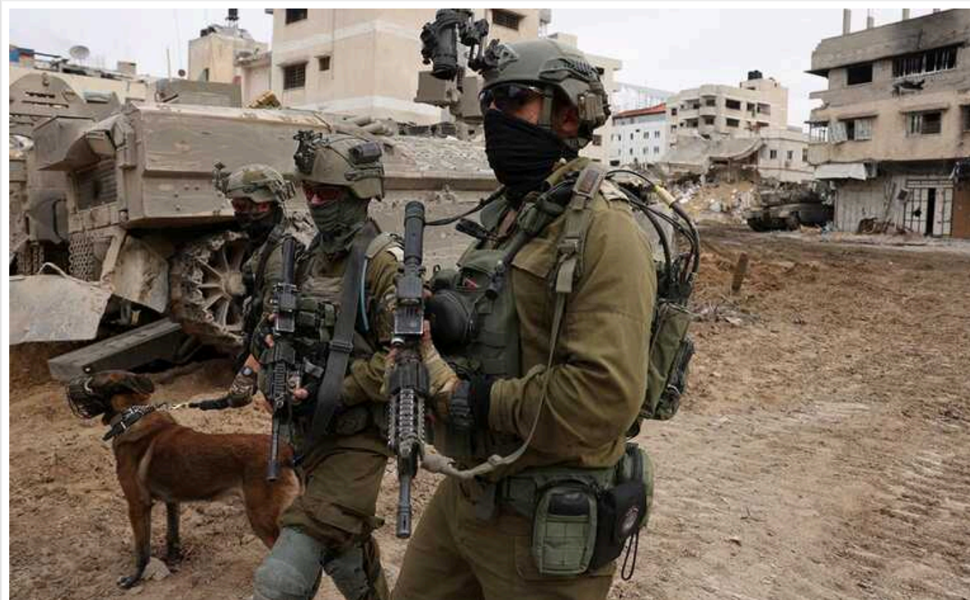
Ізраїль має величезні економічні труднощі у зв'язку з війною в Секторі Гази, яка затягується, – FT

Видання Financial Times пише, що Ізраїль зазнає величезних економічних труднощів у зв'язку з війною, що затягується, в Секторі Гази.