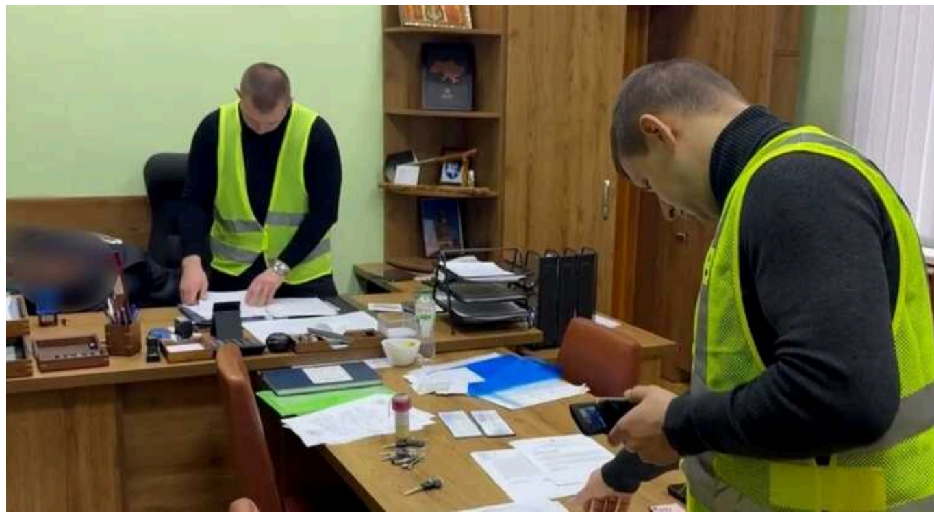
На Вінниччині поліція викрила злочинну групу посадовців Міноборони: під час проведення закупівель для військових завдали мільйонних збитків бюджету

Зловживаючи службовим становищем керівник одного з відділів Міністерства оборони разом з двома підлеглими уклали прямий неконкурентний договір з товариством із закупівлі армійських ліжок за завищеними цінами. Сума збитку, яку зловмисники завдали своїми діями державному бюджету, становить майже 4,3 млн грн.