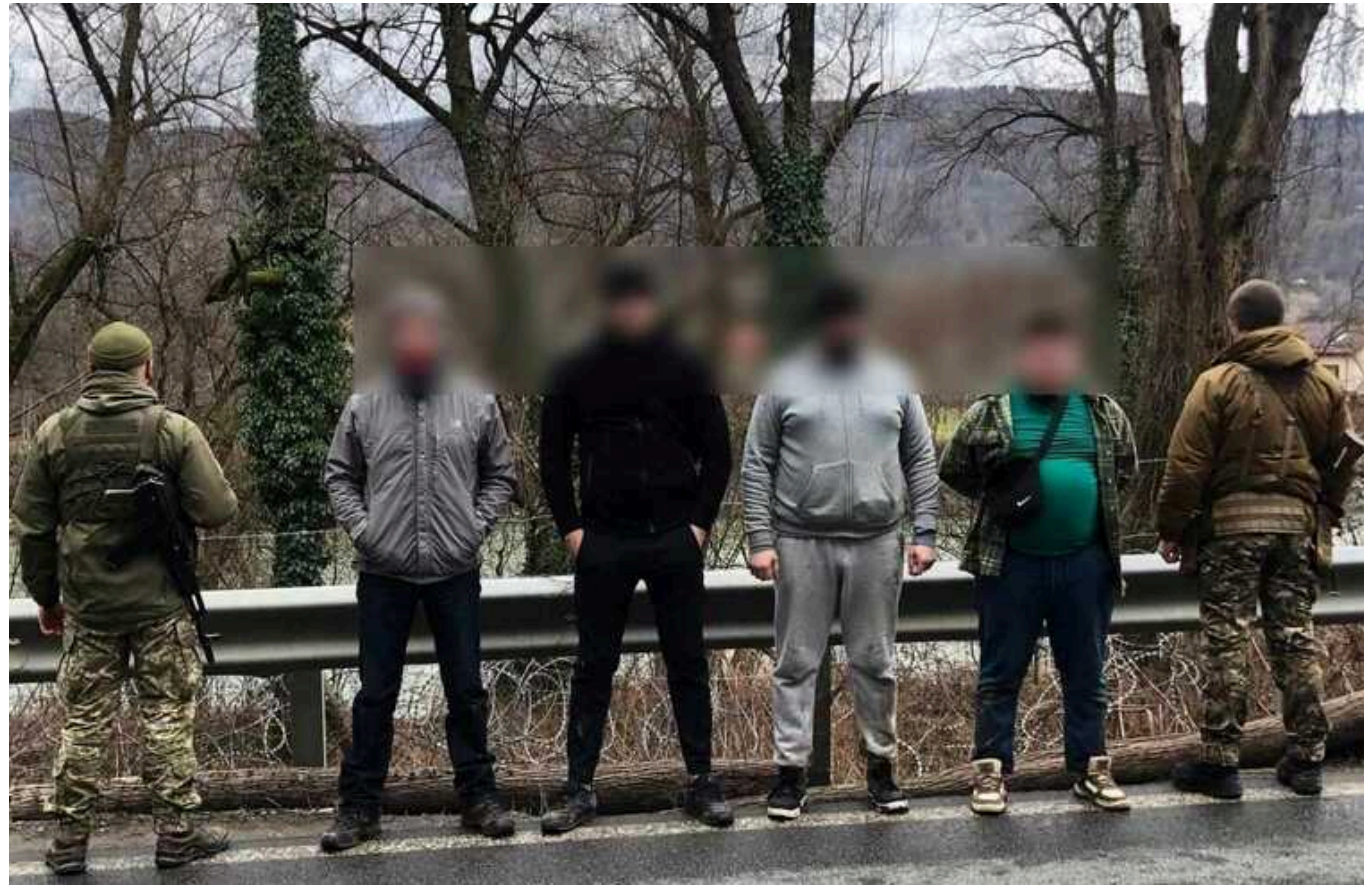
Двох іванофранківців затримали прикордонники: планували переплисти Тису із запованими у контрацептиви телефонами

Чоловіків, які намагались незаконно перетнути кордон, затримали прикордонники відділення «Великий Бичків» Мукачівського загону.