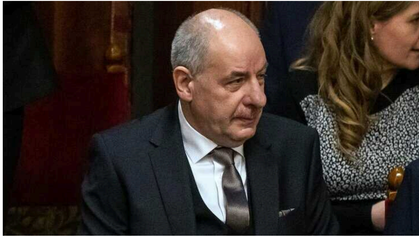
Парламент Угорщини обрав новим президентом однопартійця Орбана

Парламент Угорщини обрав новим президентом країни голову конституційного суду Тамаша Шуйока. Він є членом партії прем'єра Віктора Орбана "Фідес".