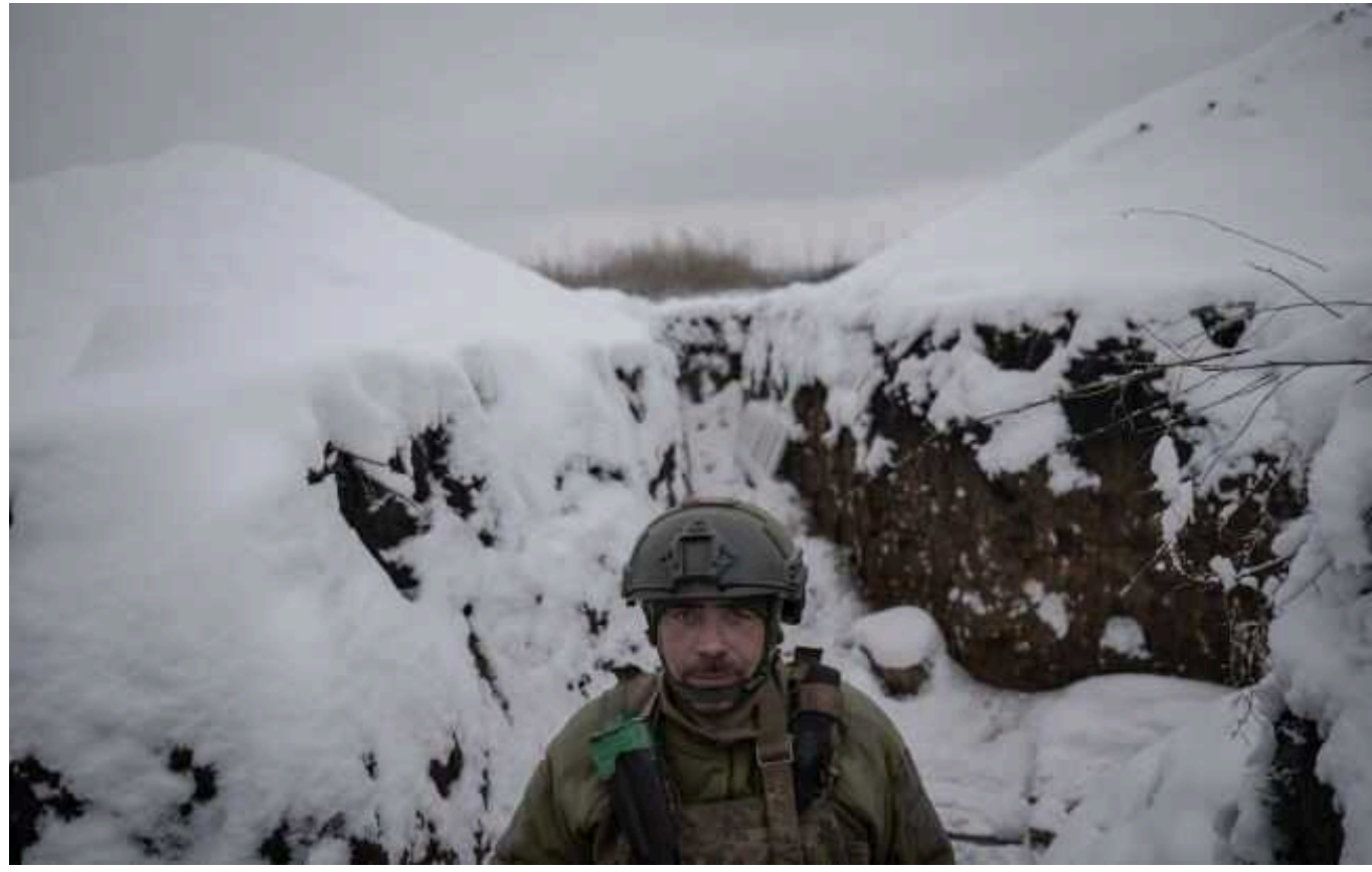
На Авдіївському напрямку не було збудовано серйозної лінії оборони ЗСУ, – Бутусов

Головний редактор «Цензора» Юрій Бутусов, за підсумками своєї поїздки на Авдіївський напрямок, повідомляє, що на захід від Авдіївки так і не було збудовано серйозної лінії оборони українських військ і російська армія продовжує просуватися вперед.