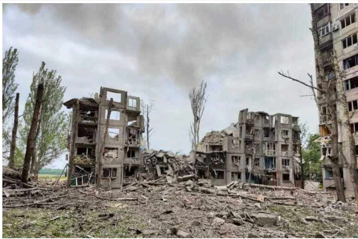
У поліції розповіли, скільки мирних жителів залишалося в Авдіївці на момент виходу ЗСУ

Близько 700 мешканців Авдіївки відмовилися їхати з міста і таким чином опинилися під окупацією Російської Федерації.