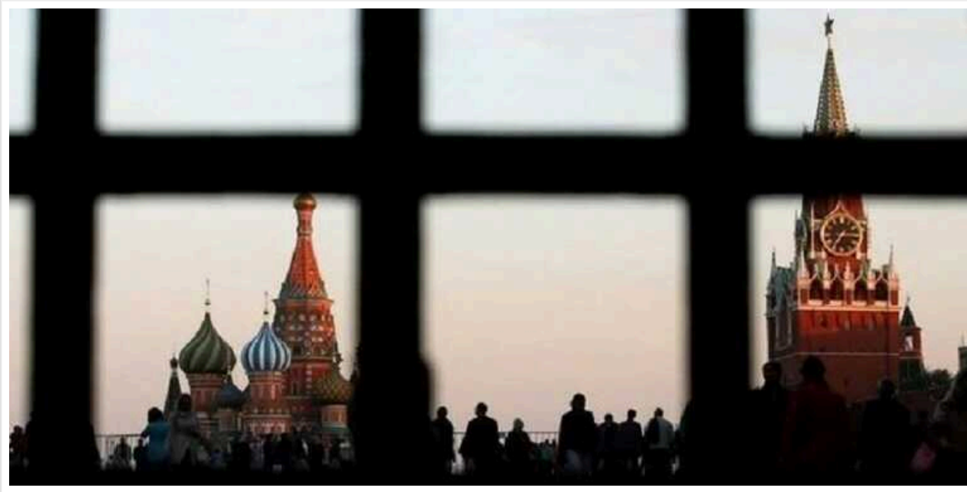
«Слово пацана» та «Холоп»: як Кремль за допомогою серіалів готує народ до перевиборів Путіна

Популярні російські серіали були включені до списку так званого «Творчого контенту до виборів».