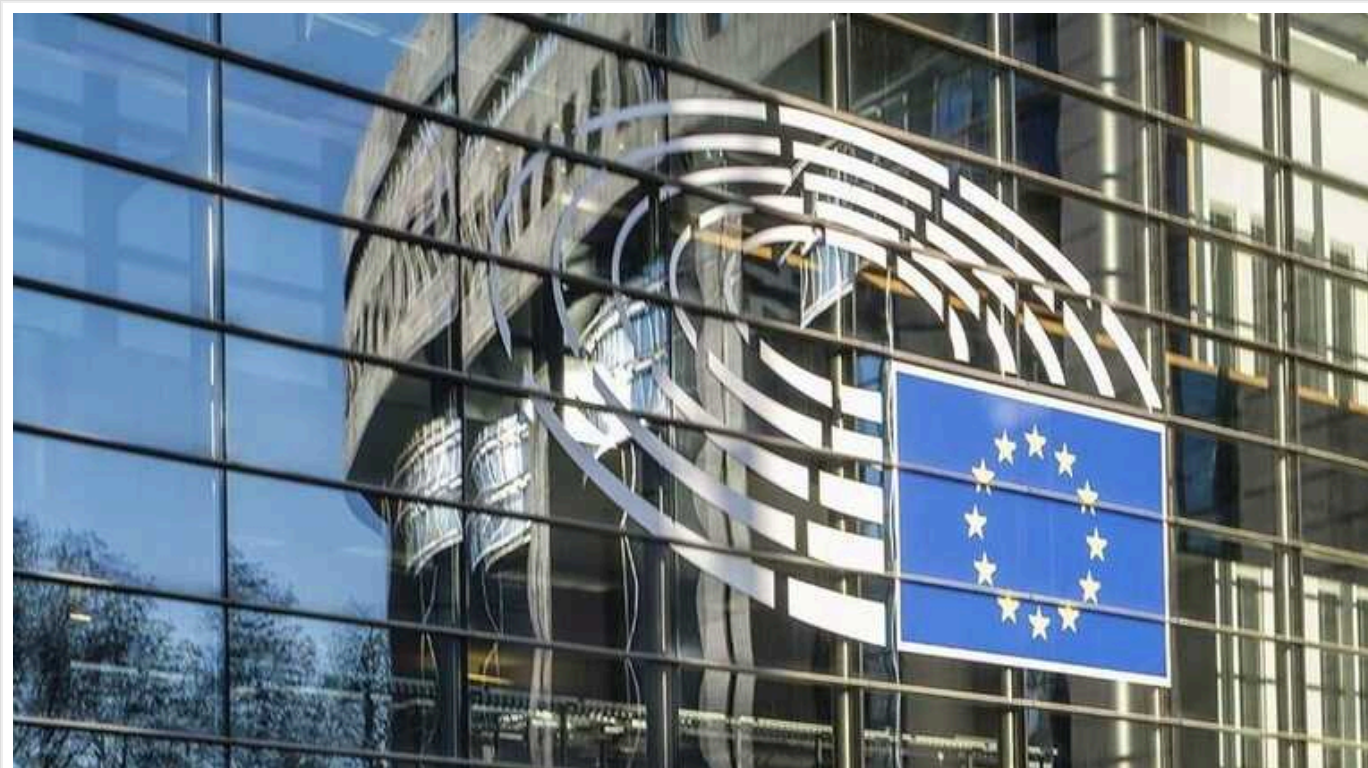
Майже третина європейців вважають, що Україні потрібно буде скоротити допомогу та стимулювати переговори щодо миру з РФ

Згідно з опитуванням 33% європейців вважають, що Україні потрібно буде скоротити допомогу та стимулювати переговори про мир з РФ, якщо це зробить Трамп у разі своєї перемоги на виборах президента США.