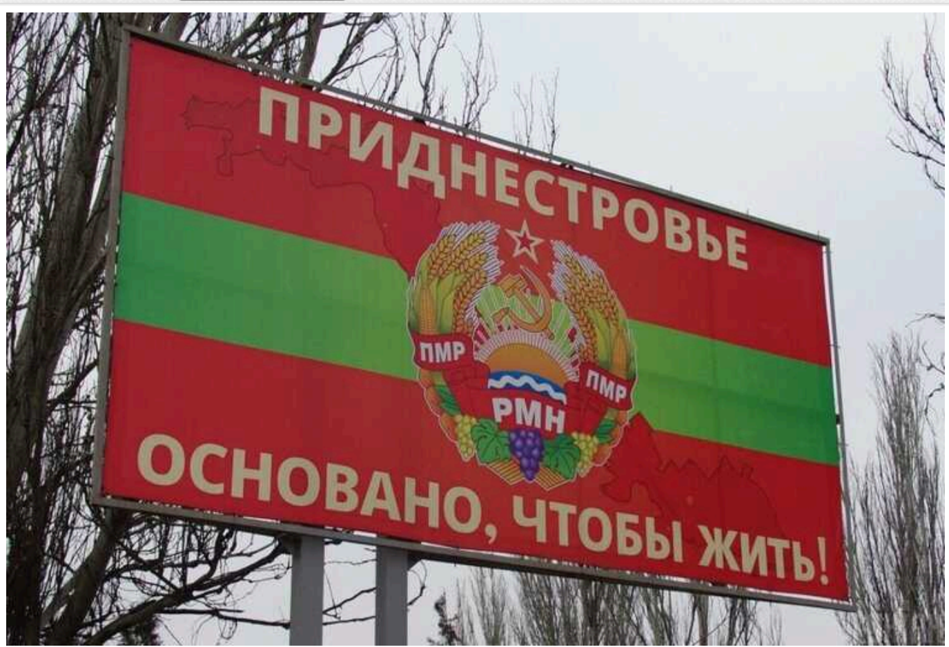
РФ натякає на "приєднання" Придністров'я: що робитиме Україна та чим це нам загрожує

У Тирасполі на 28 лютого призначено "з'їзд депутатів усіх рівнів так званої Придністровської Молдавської Республіки". На цих зборах може бути озвучено "прохання від імені громадян, які проживають на лівому березі Дністра", прийняти Придністров'я до складу Росії".