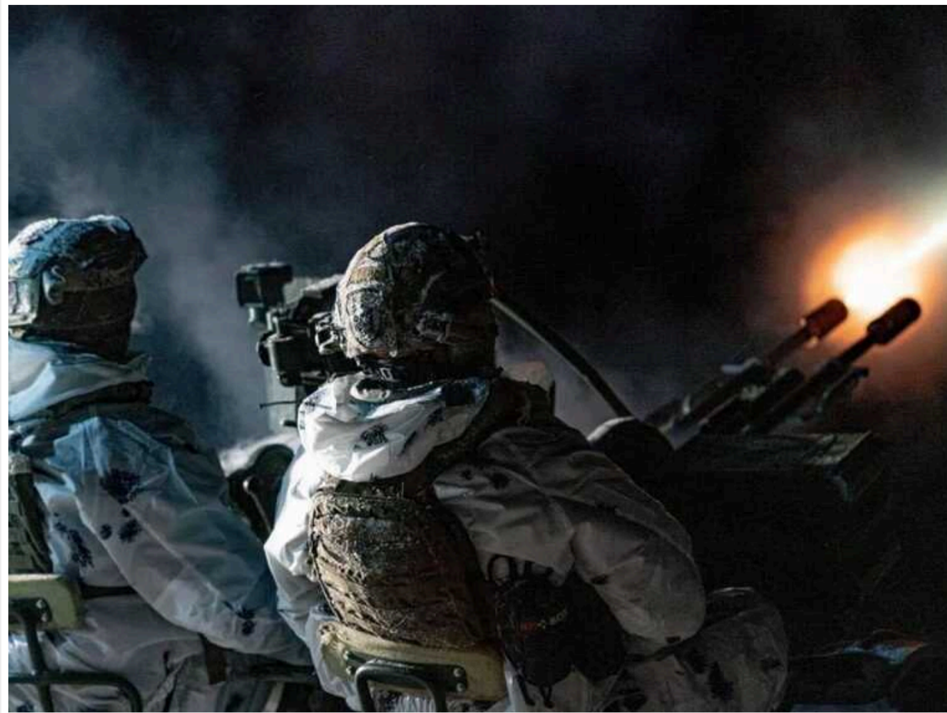
ЗСУ збили дрон над Дніпропетровською областю

Українські захисники сьогодні, 26 лютого, увечері збили російський дрон над Дніпропетровською областю.