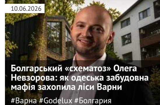
Болгарський «схематоз» Олега Невзорова: як одеська забудовна мафія захопила ліси Варни #Варна #Godelux #Болгарія