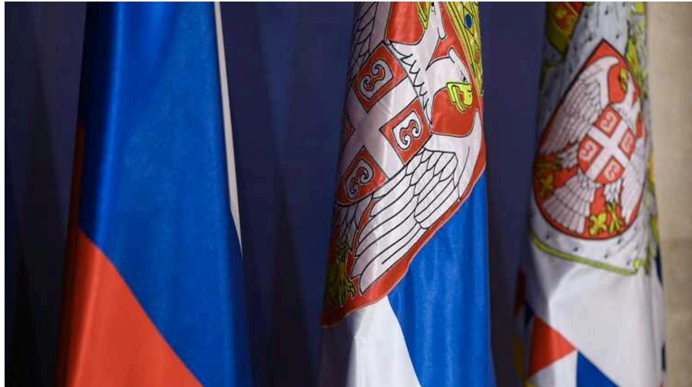
У Сербії можуть заборонити перебування в країні росіянам, які виступили проти війни, - Associated Press

Журналісти Associated Press стверджують, що їм відомо як мінімум дванадцять росіянам загрожували заборонаю на в'їзд у країну або відкликанням посвідки на проживання на підставі того, що вони "небезпечні для Сербії". Усі вони виступали проти війни.