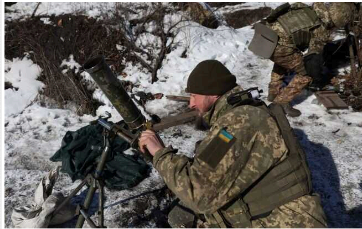
Ситуація на фронті: протягом доби відбулося 79 бойових зіткнень

Українські воїни продовжують утримувати позиції на лівобережжі Дніпра, відбили атаки росіян біля села Бердичі (Донецька область) та уразили ворожу наземну станцію керування дронами.