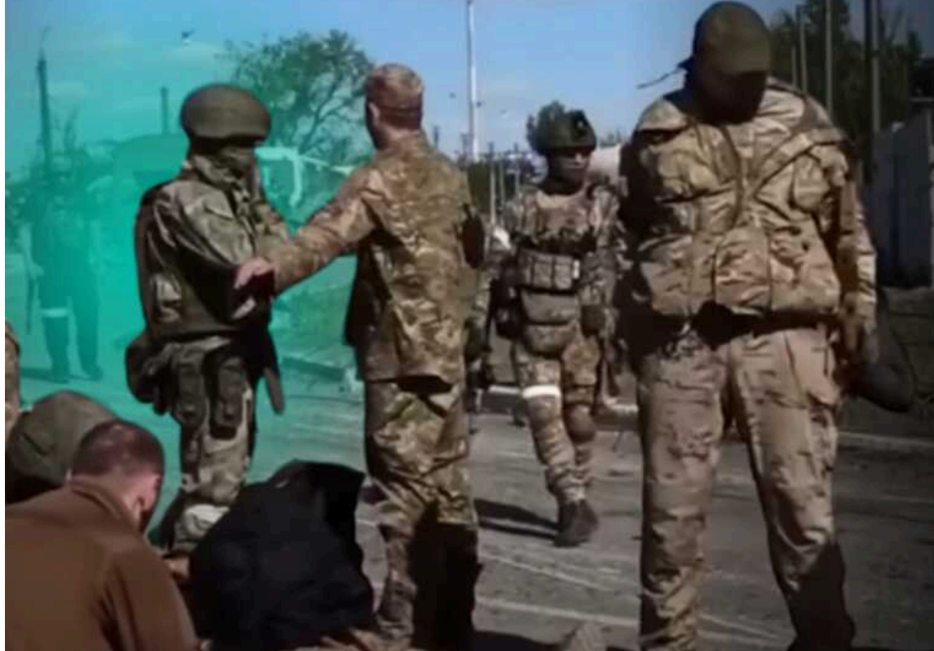
Як РФ вбиває військовополонених українців

Мініреінтеграції інформує, що з 24 лютого 2022 року до 16 листопада 2023-го у російському полоні загинуло 49 українців. Станом на січень 2024 року МІПЛ відзнала про 21 українського військовополоненого, загублого безпосередньо в місяцях несвободи — ці дані не враховують убитих азовців в Оленівці в ніч на 29 липня 2022-го. Також відома про випадки страт одразу після взяття у полон. У Медіацентрі Україна — УкрІнформ МІПЛ презентувала аналітику про те, що відбувається з українськими військовополоненими.