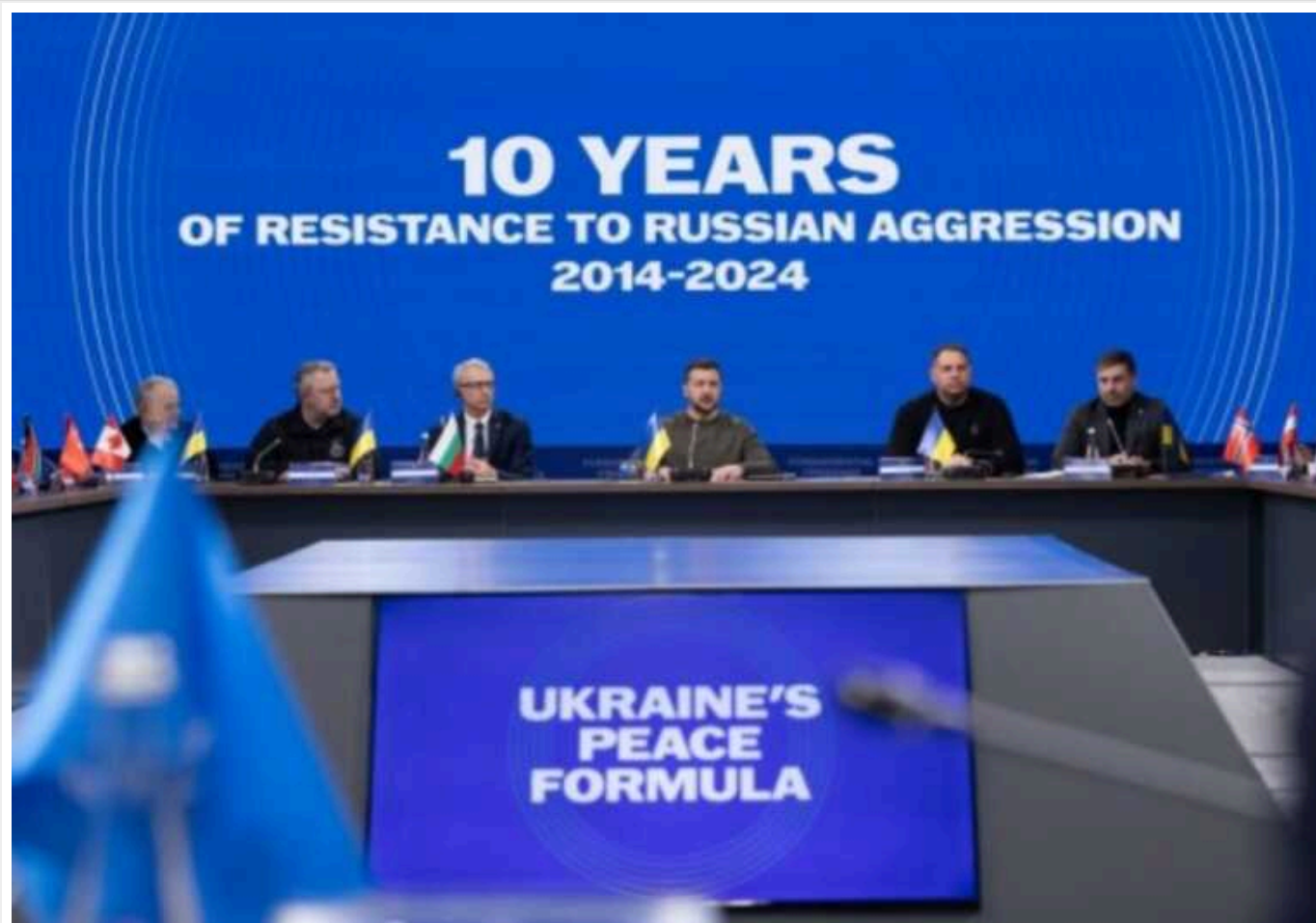
"Маємо робити максимум, щоб повернути всіх українців додому", - Зеленський

Невідомо, скільки наших громадян утримуються у російському полоні, але Україна та партнери мають робити максимум, щоб повернути всіх українських людей додому.