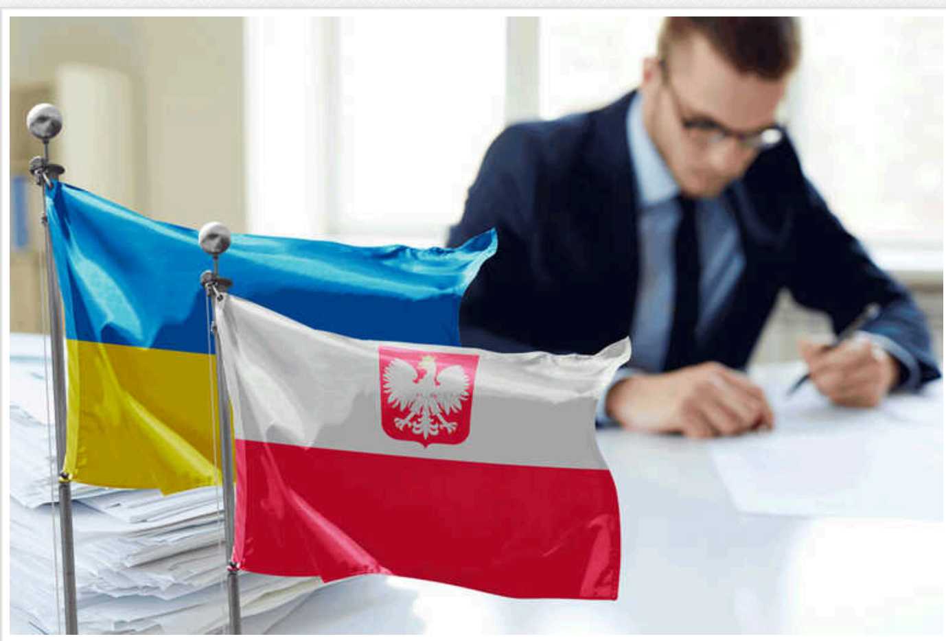
Польський бізнес в Україні: власники, виручка та "російський слід" у діяльності

В Україні станом на лютий 2024 року працює 3 635 польських компаній. Фахівці R&D-центру YouControl з'ясували, що менше половини з них оприлюднили фінансову звітність за 2022-й та мають понад 63 млрд грн сукупної виручки за підсумками 2022 року. Більш ніж половина польських компаній зареєстровані на Львівщині та у Києві. У структурі власності 18 юридичних осіб, крім учасників/бенефіціарів з Польщі, присутні громадяни Росії та Білорусі. В яких сферах працює польський бізнес в Україні та які компанії входять до п'ятірки найбільших за виручкою та статутним капіталом — у вслідженні YouControl.