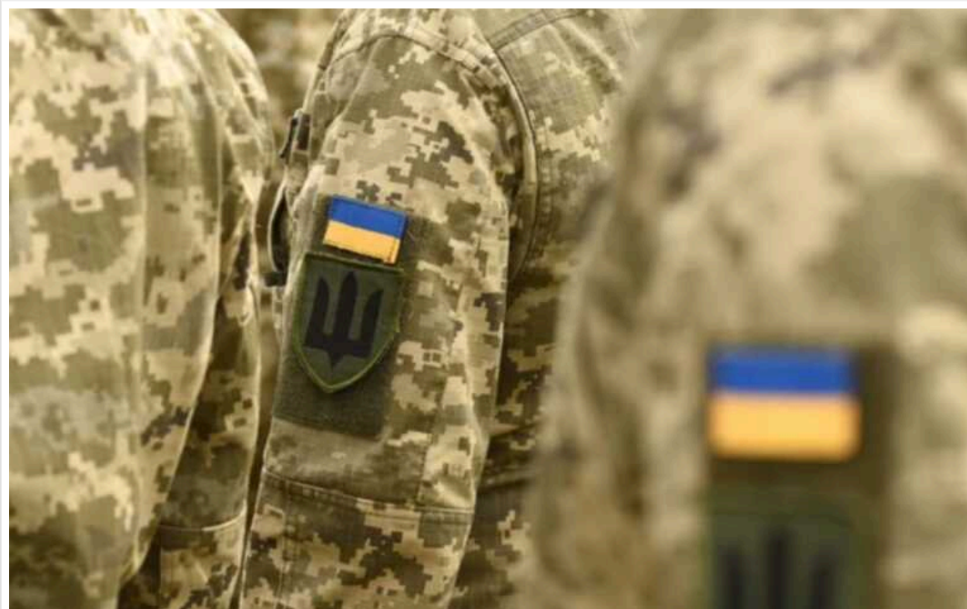
Мобілізація в Україні: кого можуть призвати у березні, і скільки триває підготовка перед відправленням на фронт

Верховна Рада ще остаточно не схвалила новий законопроект про мобілізацію в Україні, тож у березні 2024 року призов до війська триватиме за тими самими правилами, що й раніше. Під мобілізацію підпадають чоловіки віком від 18 до 60 років, визнані придатними до військової служби.