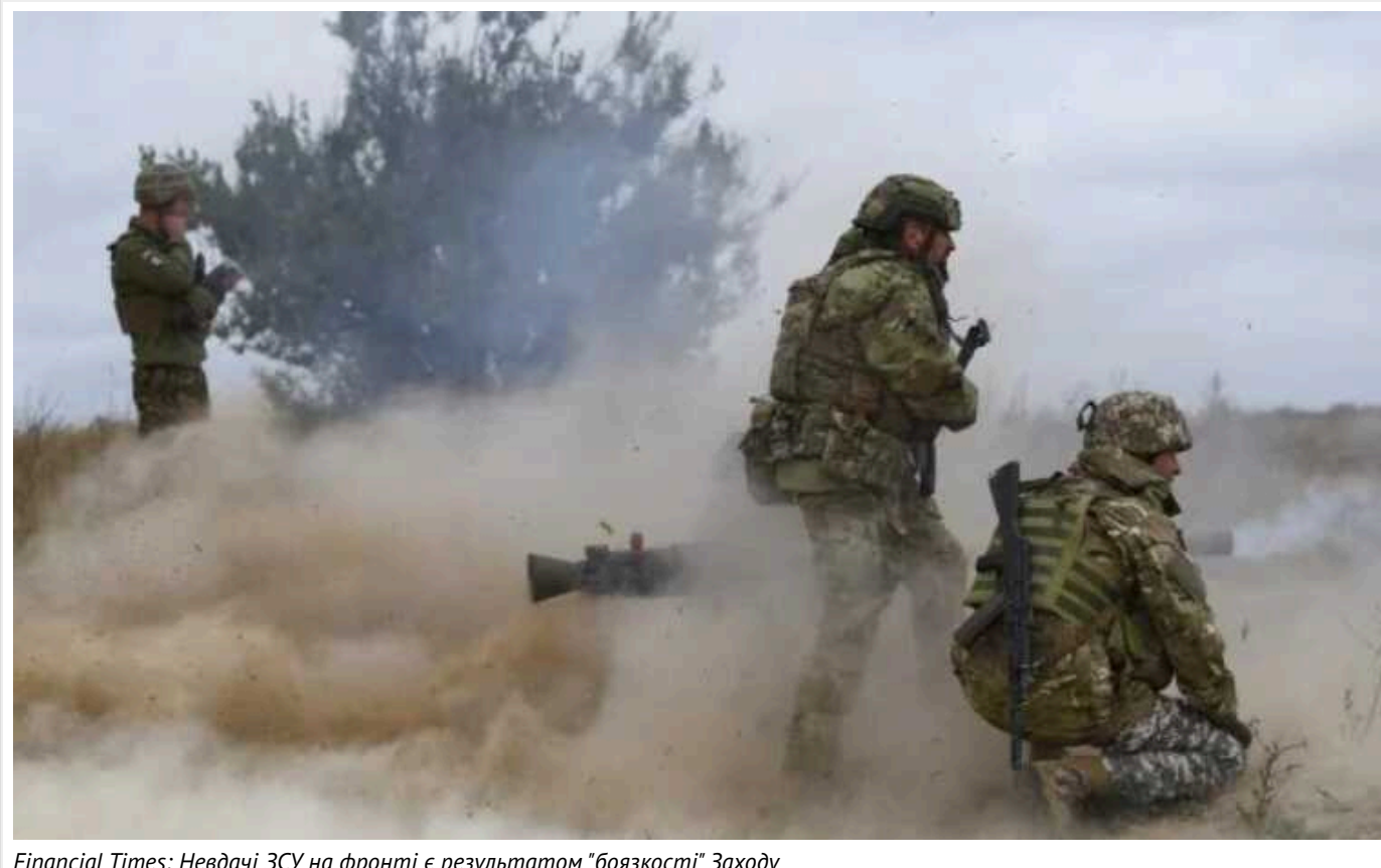
Financial Times: Невдачі ЗСУ на фронті є результатом "боязкості" Заходу

За словами журналістів, західні партнери не докладають достатніх зусиль у передачі зброї Києву і введенні санкцій проти РФ.