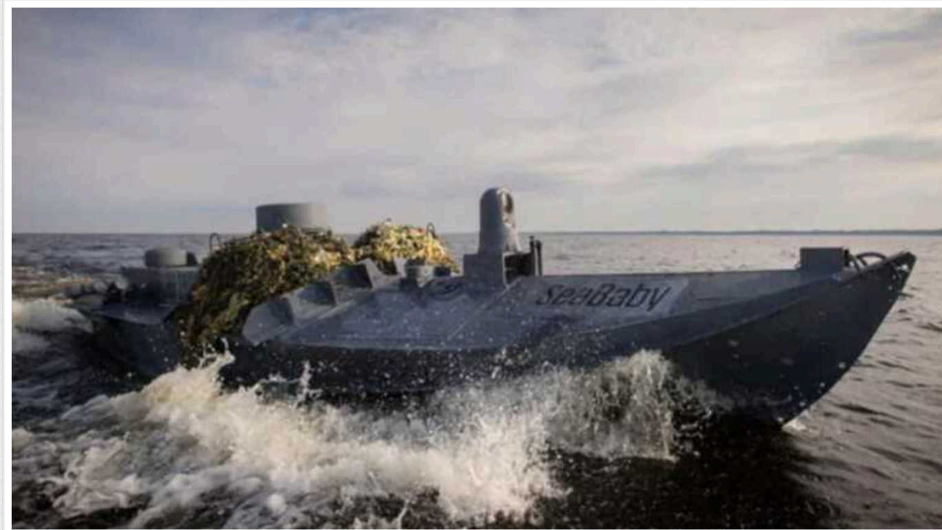
У РФ придумали, як знищувати морські дрони ЗСУ "за секунди", але їм дещо заважає

Російські інженери вважають, що знищувати українські надводні безпілотники допоможуть дорогі тепловізори.