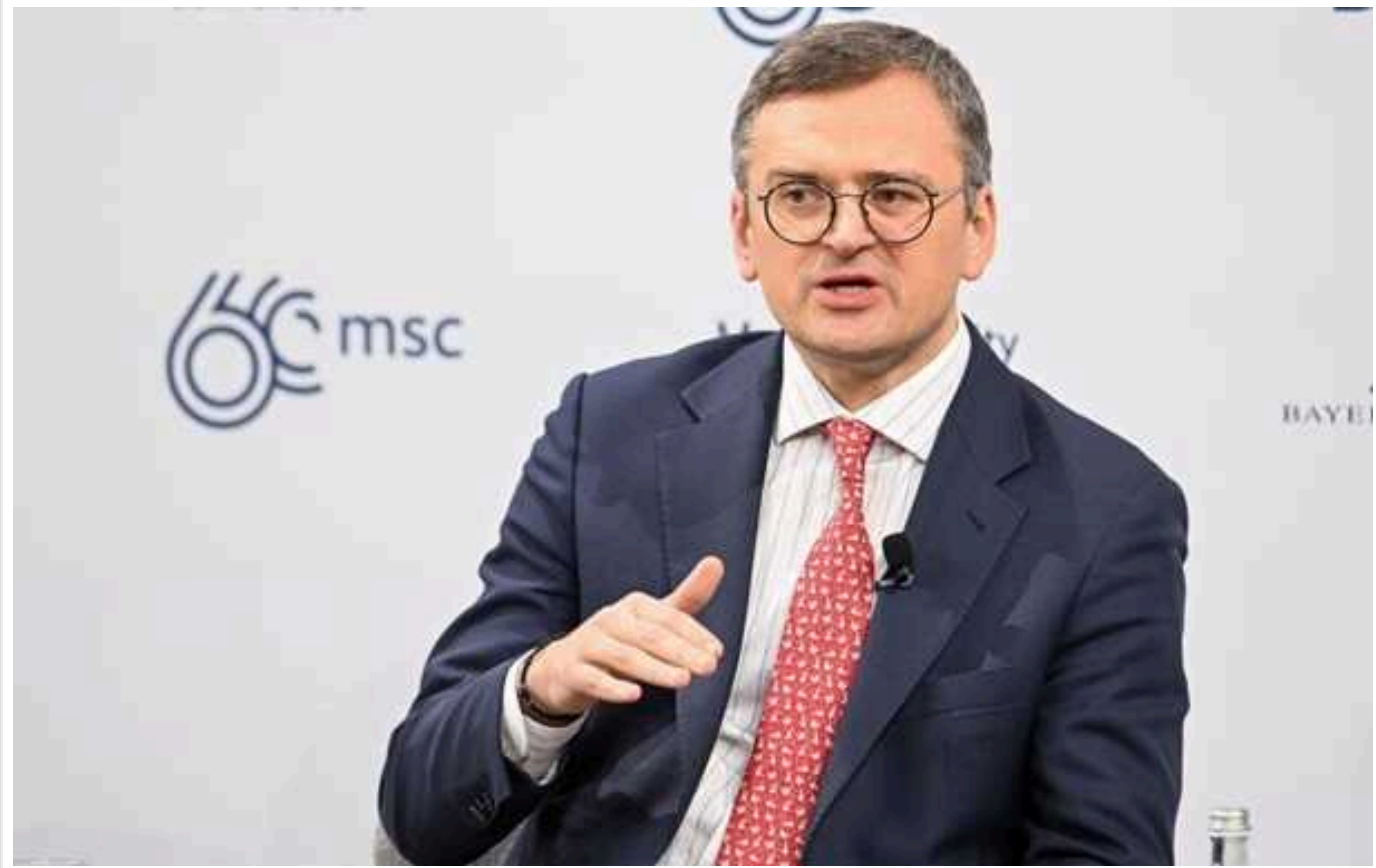
Кулеба розповів, на що вистачило б заморожених російських активів в Європі

Активи Центрального банку РФ заморожені у різних західних юрисдикціях на суму понад 300 млрд доларів. Тільки активів, які "зависли" у Франції, вистачило б, зокрема, для будівництва нової ГЕС замість Каховської.