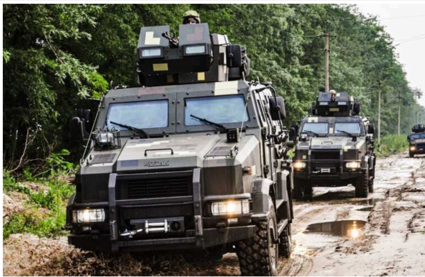
Броньовані автомобілі, які виробляє «Українська бронетехніка», на 30% дешевші за імпортні