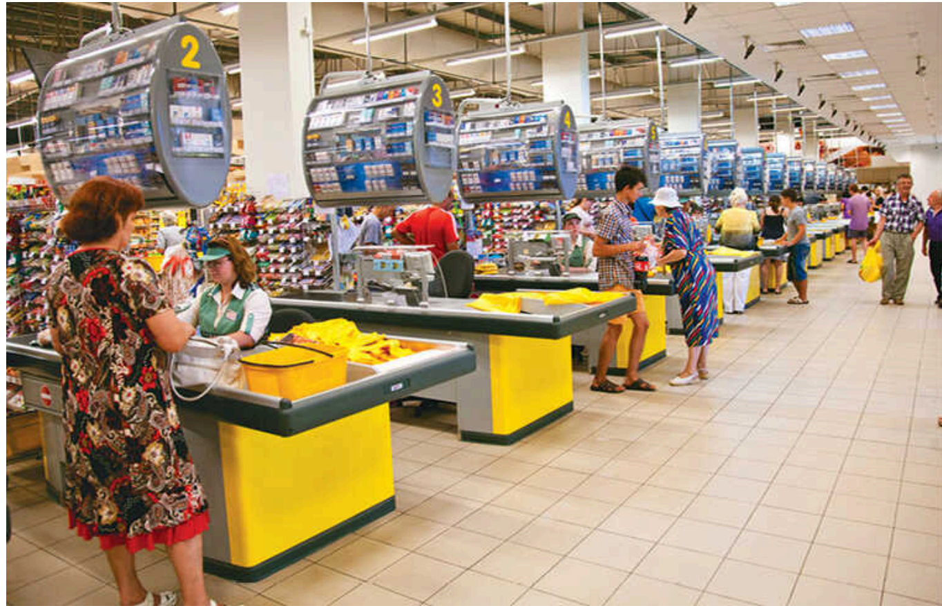
На касах в супермаркетах відмовляються приймати в українців деякі гривні: у чому причина

Касири в супермаркетах можуть відмовитись приймати ті чи інші купюри – під приводом того, що їм нічим давати здачу. Таке ж може статись і з монетами. Однак подібна поведінка касирів є порушенням законодавства про захист прав споживачів.